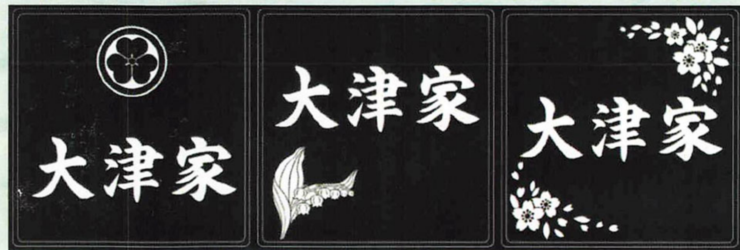
【彫刻デザイン一例】