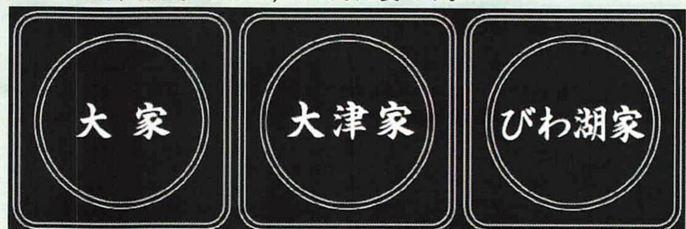
【彫刻デザイン一例】