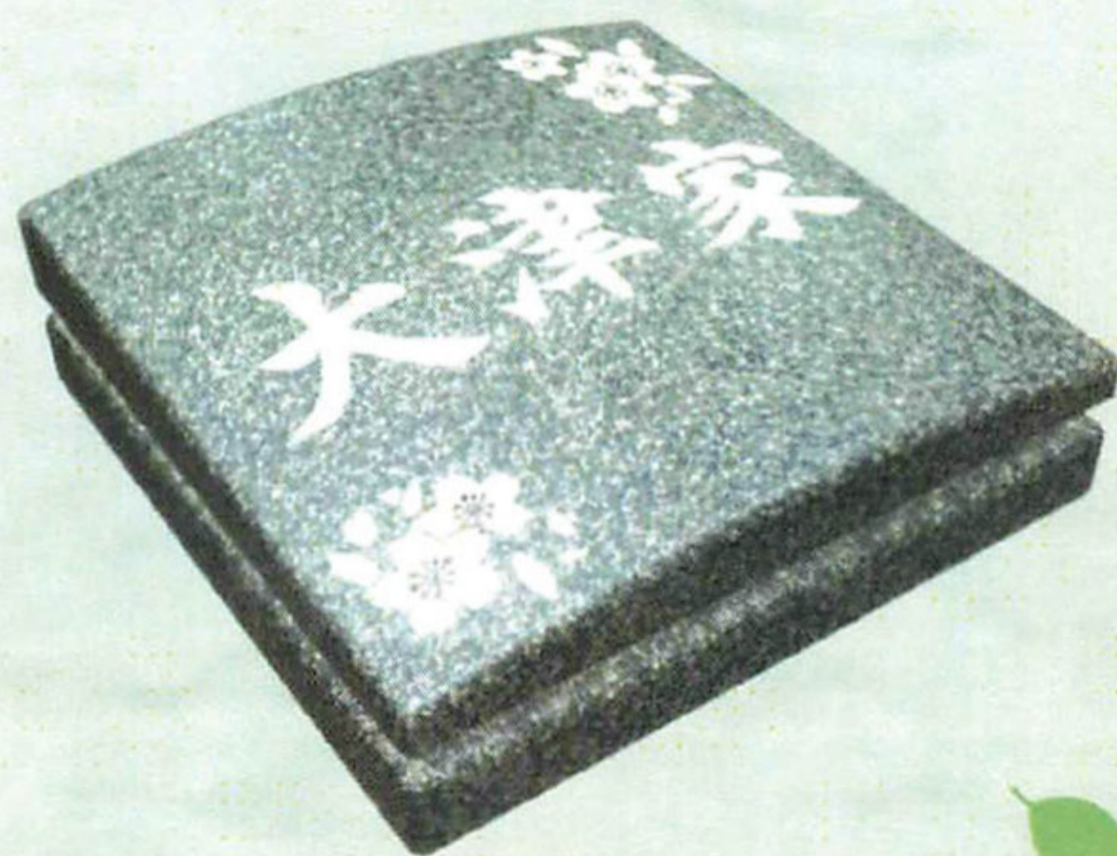
【施工例:石板(四角型)】

指定の彫刻デザインから、お好みのデザインをお選びいただき家名とともに彫刻できます。